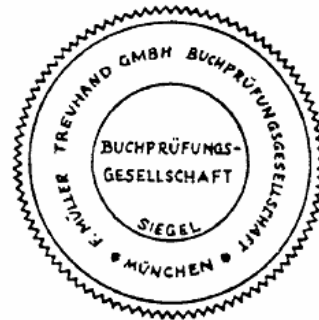
Siegel einer Buchprüfungsgesellschaft