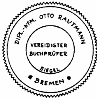
Siegel eines vereidigten Buchprüfers