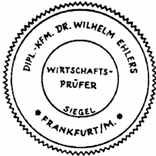
Siegel eines Wirtschaftsprüfers