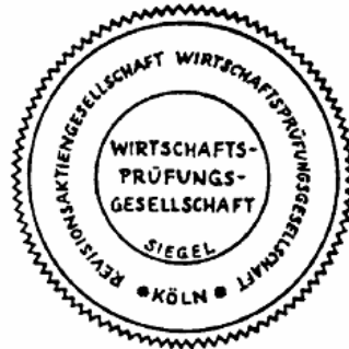
Siegel einer Wirtschaftsprüfungsgesellschaft